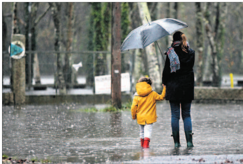
Una madre pasea con su hijo por un parque en Lugo.

El abogado y asesor fiscal apunta que, teniendo en cuenta los plazos de prescripción, los contribuyentes que cobraron desde enero de 2012 prestaciones por maternidad pueden presentar ante la Agencia Tributaria una rectificación de autoliquidación del IRPF en la que solicitan la devolución de lo tributado por